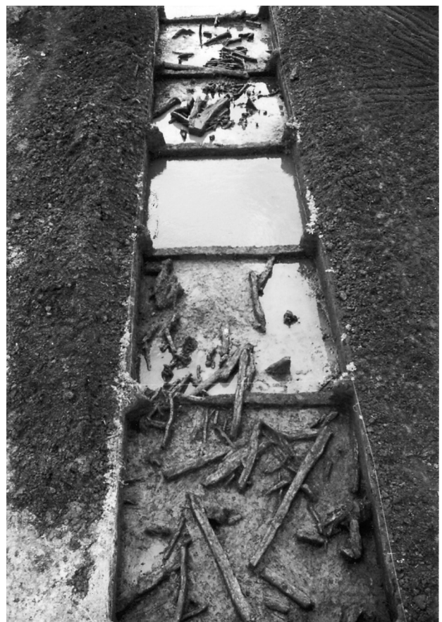
Fot. 1. Zdjęcie lotnicze grodziska w Wolsku

Z racji swej wąskiej specjalizacji gospodarczej, społeczności cyklu wstęgowego niezmiennie zajmowały obszary o ciężkich, żyznych glebach. Siłą więc rzeczy nie stworzyły na omawianym obszarze gęstej sieci osadniczej. Niemniej jednak w oparciu o liczne