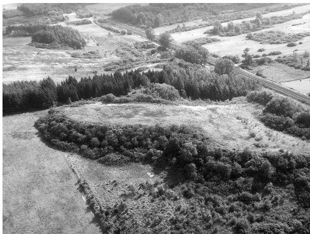
Fot. 2. Koncentracja stanowisk archeologicznych z neolitu i wczesnej epoki brązu w rejonie strefy przeprawowej w Żuławce Małej

Na leżącym w obrębie powiatu pilskiego odcinku doliny Noteci wyróżniają się dwie przeprawy: leżące w rejonie Ujścia–Nietuszkowa (fot. 3) oraz Żuławki Małej–Osieka n. Notecią. W obu przypadkach lokalizacja jest nieprzypadkowa i związana z wykorzystaniem pól wydmywych i wałów wydmywych w charakterze naturalnych pomostów komunikacyjnych (poruszone: Krapiec i in. 1996, Owiśniany, Ratajczak-Szczerba 2010). W oparciu o te formy, uzupełniane w razie potrzeby drewniano-ziemnymi konstrukcjami przeprawowymi (Rola 2009), powstały stabilnie wykorzystywane przeprawy. Wokół nich rozwinęły się silne skupiska osadnicze, wyraźnie zaznaczone we wszystkich okresach chronologicznych. Szczególną, trudną jeszcze obecnie do precyzyjnego