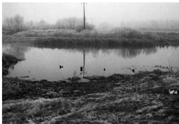
Fot. 3. Relikty przeprawy przez Notec na wysokości Nietuszkowa – Dziembówka